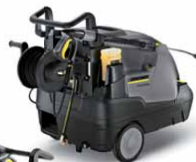
HDS 7/16 CX